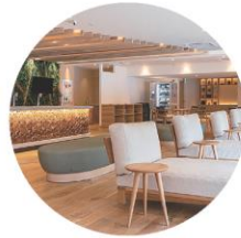
湯上がリラウンジ