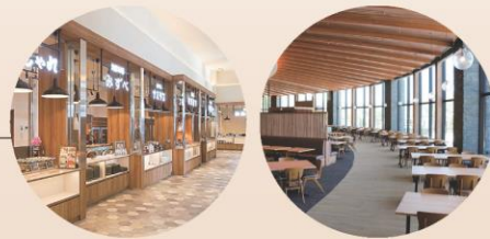
レストラン 湖畔の風