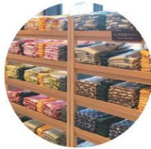
色浴衣コーナー 新本館にご宿泊の方無料レンタル