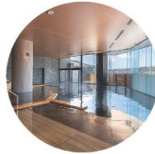
天然温泉 湖天の湯「木の湯」