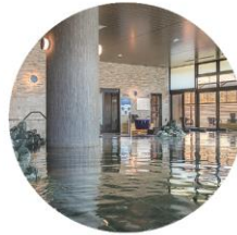
天然温泉 湖天の湯「石の湯」