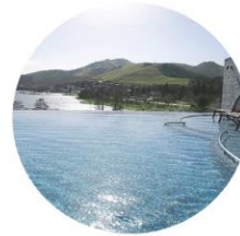
湖畔混浴「空」 湯浴み着着用の混浴エリア