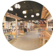
しらかば仲見世 売店・軽食・緑日広場